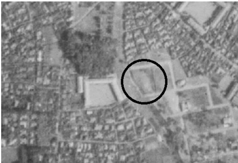
図1 1936年の代田地区（学校脇の水路横の円内に足跡形状の沼地が見える）