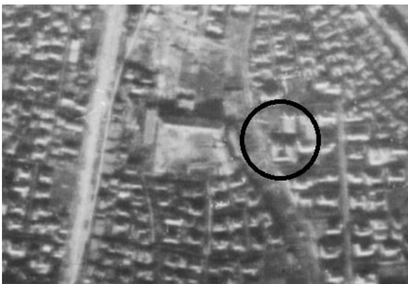
図2 1944年の代田地区（円内の沼地はすでにかなり不明瞭）