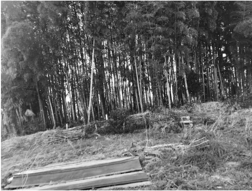
図4 ダイダラボッチの足跡とされる場所（埼玉県川越市笠幡地区）