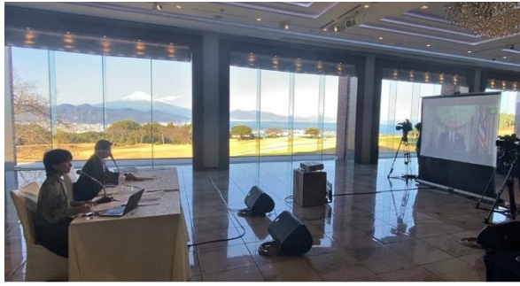
図5 静岡市SDGsフォーラム（2021年3月14日開催、日本平ホテル）の様子 （田辺信宏・静岡市長（左から2番目）とイグ・米国ハワイ州知事（右側のスクリーン）とのオンライン・セッション）