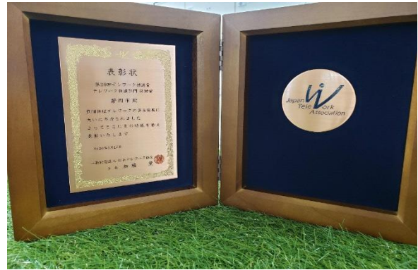
図6 第20回テレワーク推進賞奨励賞の表彰状・記念品