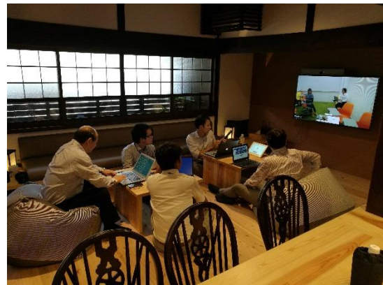
図2 実証実験の様子

これが、数年前の、テレビ会議の試行すらしていない時期にリモート会議全盛となったら、おそらくかなり混乱したものである。