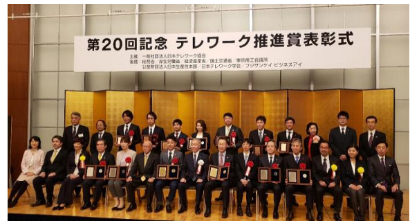
図3 第20回テレワーク推進賞授賞式(2020年2月17日)の様子

表彰式の終わりに、代表の方から「テレワーク推進賞も、20回を数えるようになった。さらに、取り組む企業、団体が増え、テレワークが当たり前前の社会になることを望む。」旨のあいさつがあり、筆者も同じ思いを持ったのだが、まさか数か月後には現実のものになろうとは、予測しなかったのである。