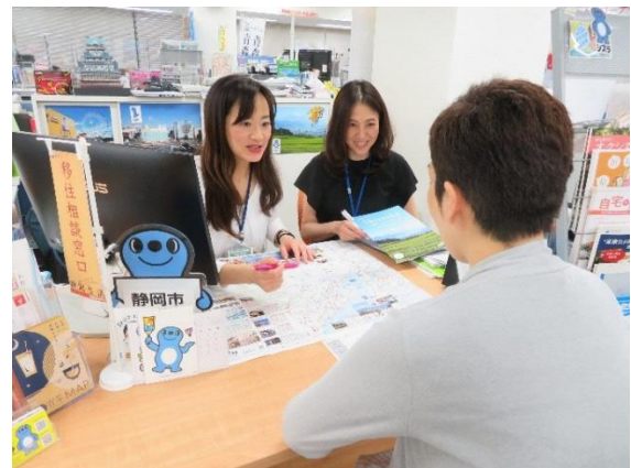
図1 静岡市移住支援センターの様子

この仮説が、「テレワーク」の実証実験につながったのである。「仕事はそのまま、住まいは静岡」のキャッチフレーズの元に、まずは市庁舎内の会議室を仮設のサテライトオフィスとして貸し出し、民間企業に試してもらったこととした。