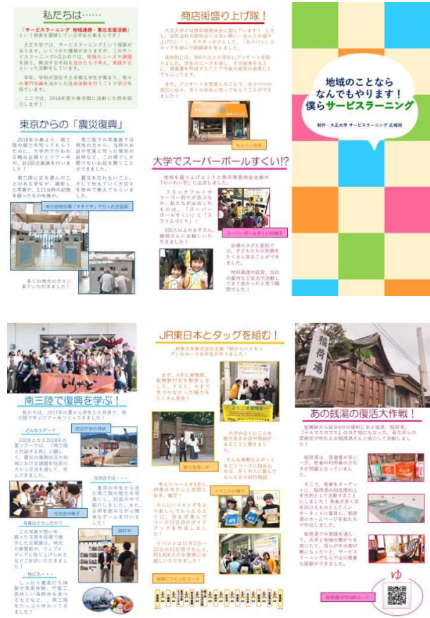
コロナ前に実施していたフィールドワーク例 (2019年制作パンフレット)

新型コロナの対応の検討を図っていた4月下旬、関係者間で協議を重ね、2020年度はオンラインでも可能なフィールドワークを実施していくことが決まった。