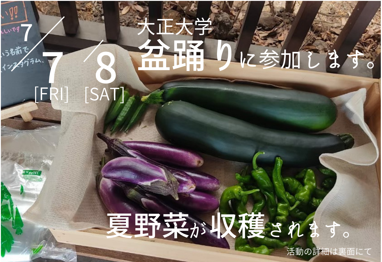
昨年の7月に収穫された野菜。右上から時計回りに、オクラ・ズッキーニ・シシトウ・ナス