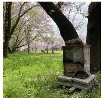
昨年埼玉校舎に設置した巣箱

が巣を作ってくれることを待ちます。待つとはいえ、埼玉校舎には植えてある桜のほかにタンポポ、オオイヌノフグリなど可憐な花々が地面一面に芽吹くため、春の時期は時を忘れてそこにいたい気持ちにさせてくれます。皆様も大正大学埼玉校舎でイベントを開催した際には巣箱と植物、野菜を見に、ぜひ足を運んでみてください。(小池)