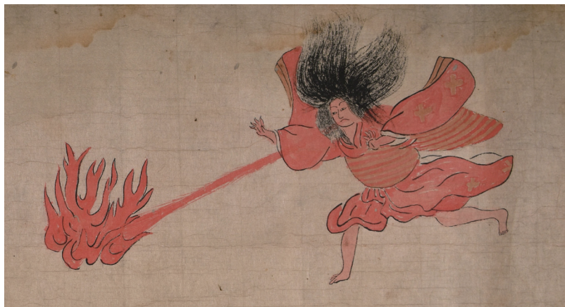
【写真7】 炎を吐く清姫（絵五）