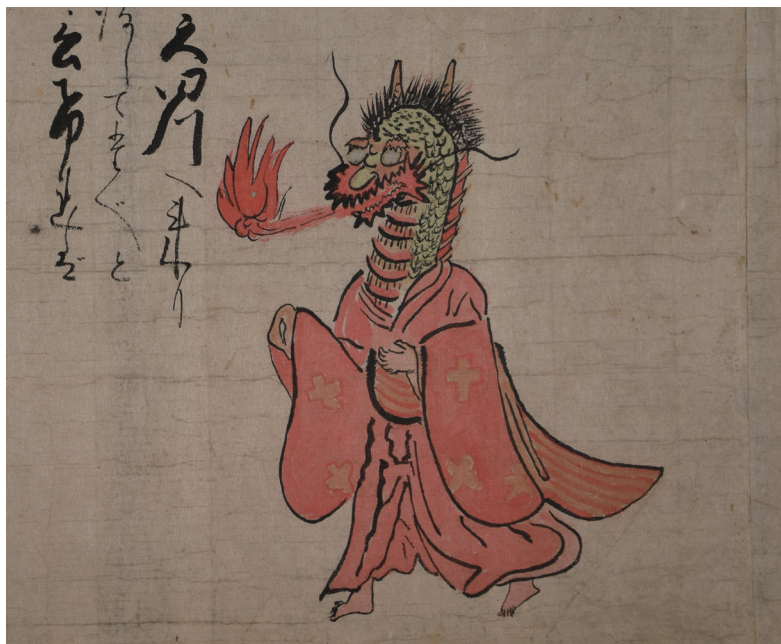
【写真8】 天田川に着いた大蛇（絵七）