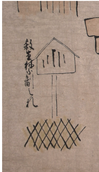
【写真17】 道成寺門前の「殺生禁制の札」（絵一〇）