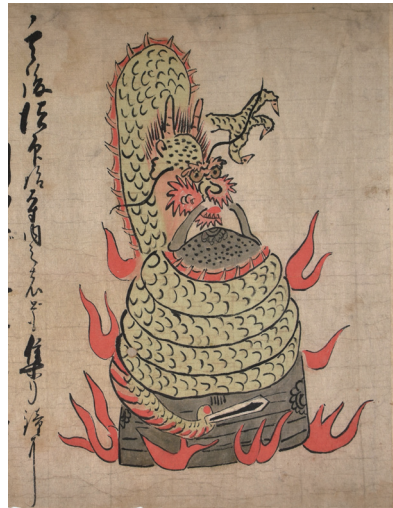
【写真12】鐘を巻く大蛇（絵一一）