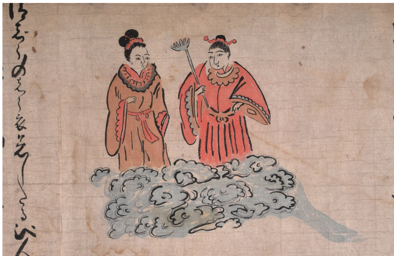
【写真16】 荘厳な衣装で現れた男女（絵一四）