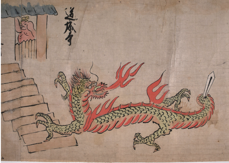
【写真11】道成寺の門を入る大蛇（絵一〇）